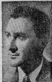
Licenciado JORGE ROSSI Candidato del Partido Independiente

TODOS somos EL PUEBLO: TODOS lo sabemos ya: EL PUEBLO está con ROSSI